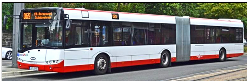
Omnibus 5654 II, Hauptbahnhof / Deutscher Ring, 2013

2012: Omnibusse 5651 III, 5652 II - 5655 II, 5656 III - 5659 III und 5662 III