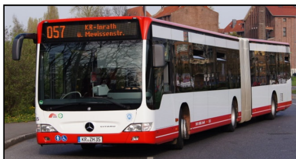
Omnibus 5635 III, Hauptbahnhof Süd, 2013