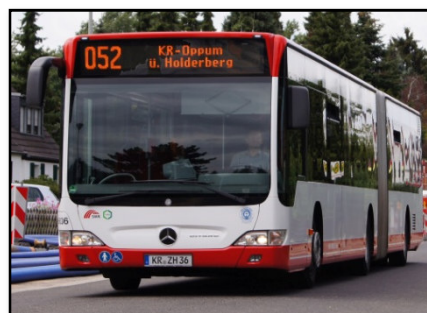
Omnibus 5636 II, Oppum Donksiedlung, 2013