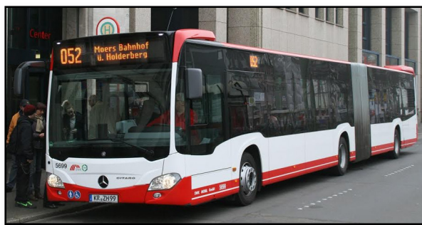
Omnibus 5699 II, Haltestelle Rheinstraße, 2013 Aufnahmen (2): © Phillip Möllers / www.niederrheinbus.de