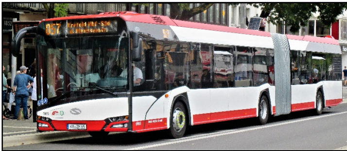
Omnibus 5665 III an der Haltestelle Rheinstraße in Fahrtrichtung Hauptbahnhof, 2017