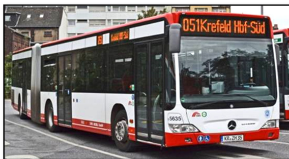
Omnibus 5635 III, Hauptbahnhof Süd, 2012

2010: Omnibusse 5633 IV, 5634 IV, 5635 III, 5636 II und 5637 III