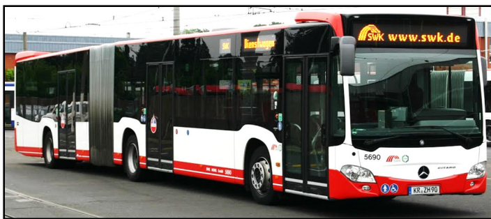
Omnibus 5690, Betriebshof Weeserweg, 2013