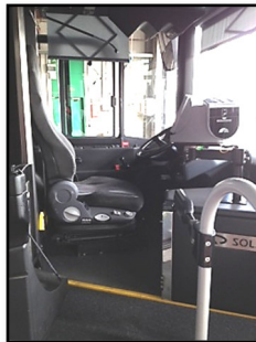
links Omnibus 5650, Innenansicht vom Nachläufer zur Front, 2011