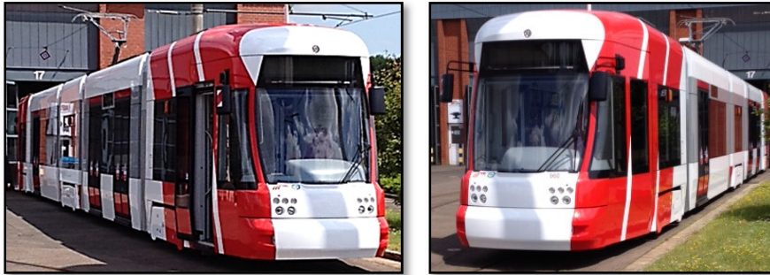
Triebwagen 660, Bahnhof Weeserweg, 30.06.2014