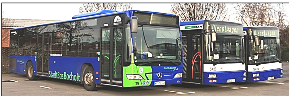
Omnibusse 5423 III und 5424 III, in Bocholt, mit Krefelder Zulassung und blauen Streifen (Mitte und rechts), 2013