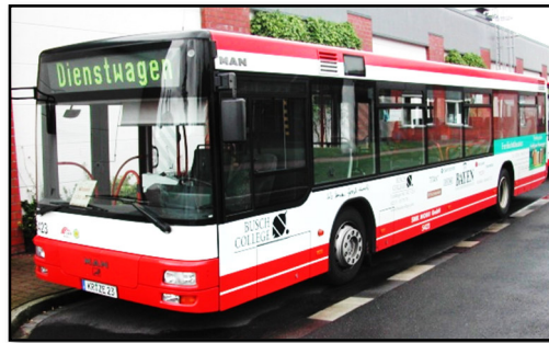
Omnibus 5423 III, Betriebshof Weeserweg, 2006