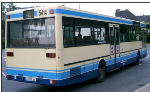
Omnibus 5414 III, Hauptbahnhof Süd, 2003