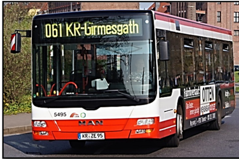
Omnibus 5495 II, Hauptbahnhof Süd, 2010

2007: Omnibusse 5490, 5491 III - 5493 III, 5494 II - 5497 II