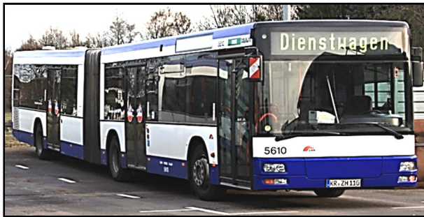
Omnibus 5610, nach seiner Umsetzung zum Stadtbus Bocholt mit Krefelder Zulassung und blauen Streifen, 2013