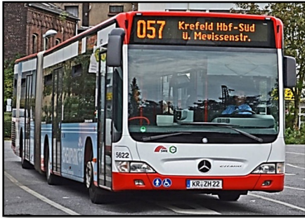
Omnibus 5622 III, Hauptbahnhof Süd, 2010

2009: Omnibusse 5618 III, 5619 III, 5620, 5621 III - 5625 III und 5626 IV