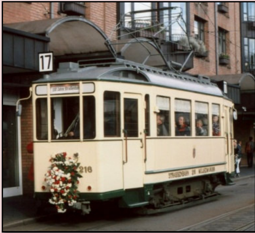
Tw 216 aus Mülheim/Ruhr, Hauptbahnhof/Hansacentrum, 31.10.2000