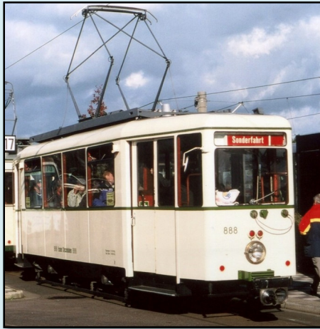
Tw 888 aus Essen, Grundend, 31.10.2000