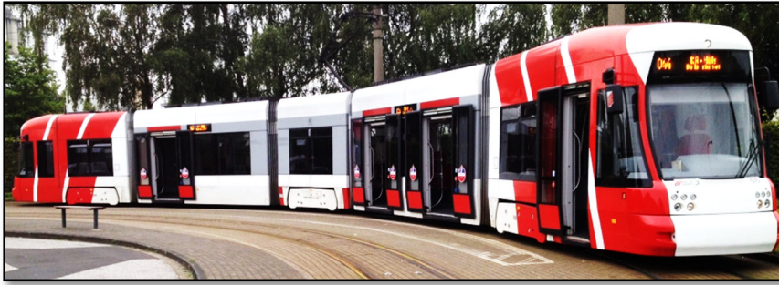
Tw 616 II, Rheinhafen, 13.07.2014