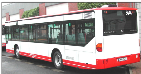
Omnibus 5444 III, Betriebshof Weeserweg, 2006