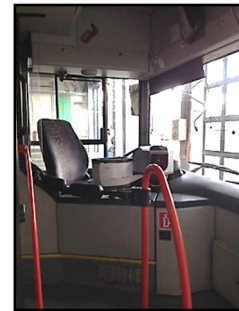
links Omnibus 5605 II, Betriebshof Weeserweg, 2006 rechts Omnibus 5609, Fahrerarbeitsplatz, 30.06.2014