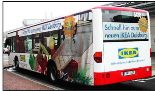
Omnibus 5430, Betriebshof Weeserweg, 2006